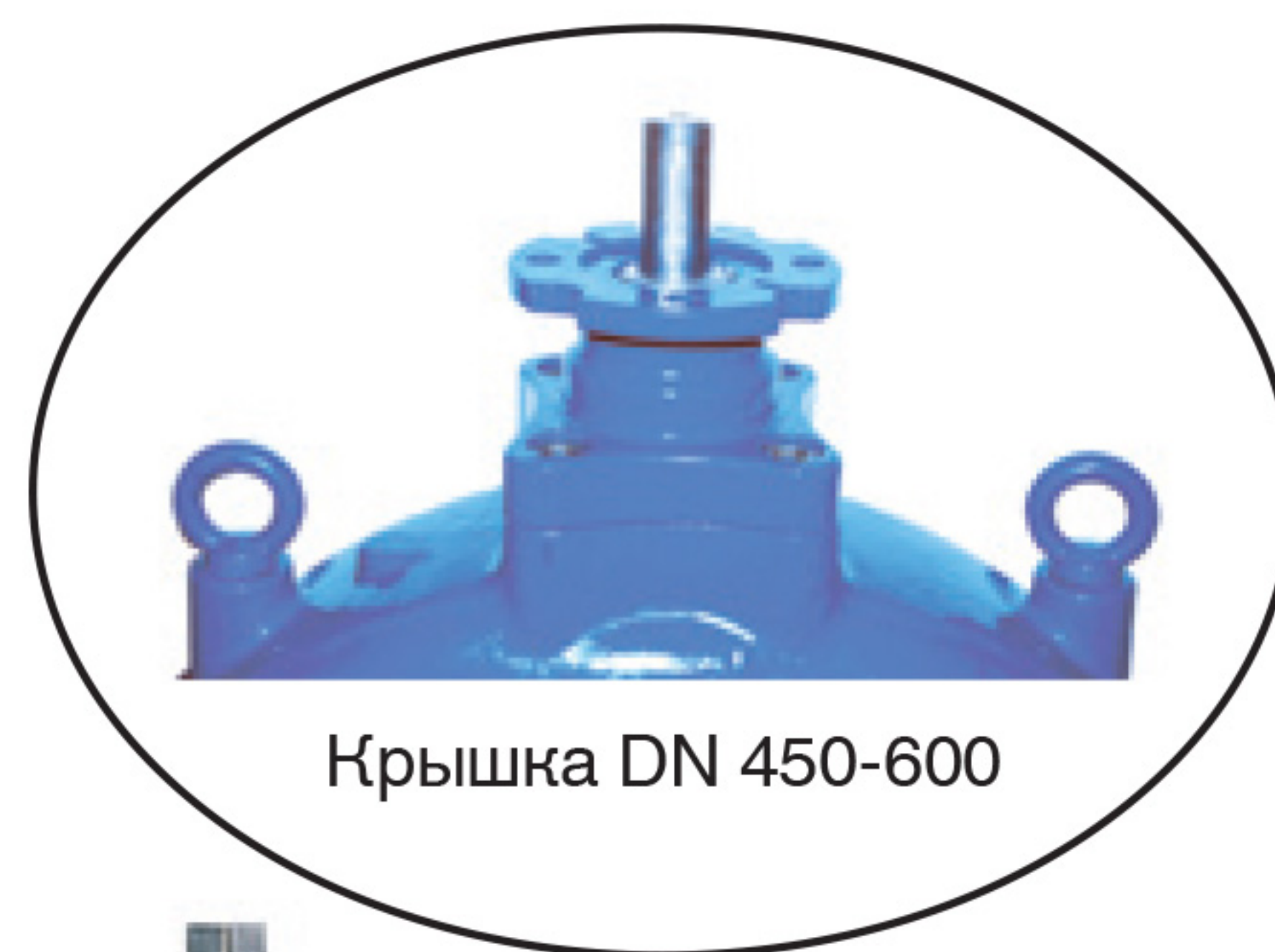
Крышка DN 450-600